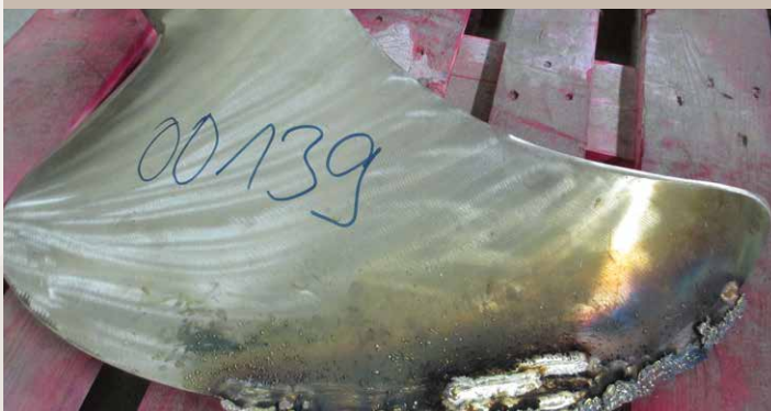
3. 焊接处理破坏部分